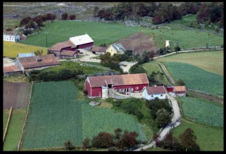
1961 - Eikeland på Heia