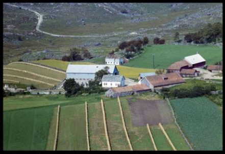
1961 - Eikeland på Heia