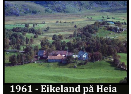
1961 - Eikeland på Heia