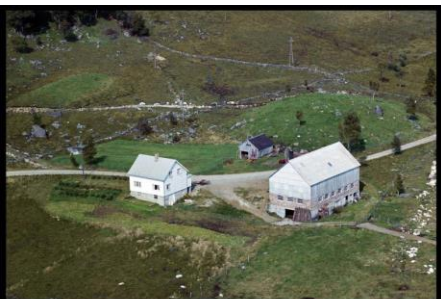
1961 - Eikeland på Heia