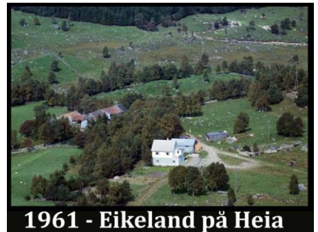
1961 - Eikeland på Heia