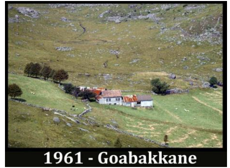
1961 - Goabakkane