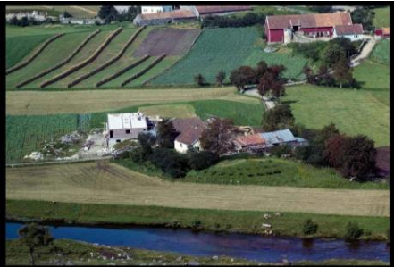
1961 - Eikeland på Heia