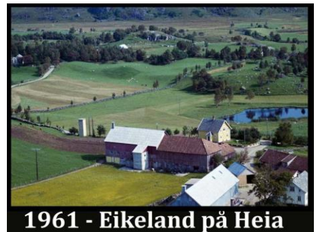
1961 - Eikeland på Heia